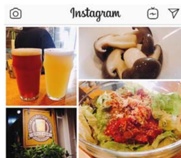
quemlin ビアバイシイ https://quemlin.com/detail/?id=307 東京都文京区千駄木にあるクラフトビアバ。一回はスタンドバー、二階はカフェスタイル。一人で気楽に、仲間とワイワイ、様々なスタイルでクラフトビールと美味しい食事が楽しめます。本シメジのピクルスが美味しかったです。日曜には限定のサンデーローストがあります。タバコのおいが強いでもちろん開店当初から禁煙。小さいお子様連れで来られる方も多いそう。 #ケムラン #文京区 #世界禁煙デー #禁煙週間 #ビアバイシイ #craftbeerbar

参加方法 ：instagram, twitter, Facebook（公開）で、ハッシュタグ #ケムラン #世界禁煙デー を付けて、 ケムラン対象店 （屋内完全禁煙&加熱式・電子たばこNGの飲食店）で撮影したお料理や店の外観・内観、従業員の方の写真をシェアして下さい。文京区のお店の場合は #文京区 もお忘れなく。厳正なる審査の上、「ケムラン賞」「文京区ケムラン賞」（QUOカード500円）を進呈いたします。